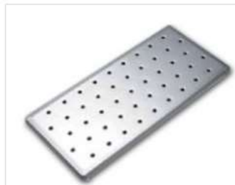
HS800/810水切りプレート カートに追加