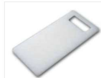
HS800/810まな板 カートに追加

独自のスリット構造により、排水能力の大幅な向上を実現。また従来にない泡切れのよさで節水効果も。